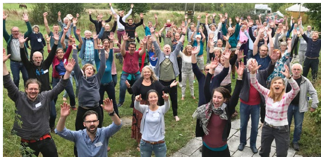
GWÖ Sommerwoche 2020