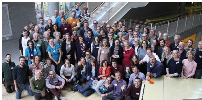
Internationale Delegiertenversammlung 2019 in Stuttgart.